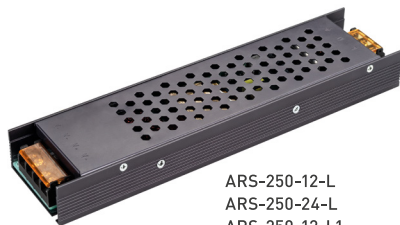
ARS-250-12-L ARS-250-24-L ARS-250-12-L1 ARS-250-24-L1