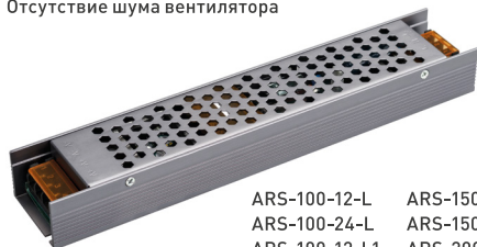
ARS-100-12-L ARS-150-12-L ARS-100-24-L ARS-150-24-L ARS-100-12-L1 ARS-200-12-L ARS-100-24-L1 ARS-200-24-L